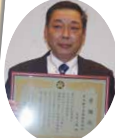
日本磁力選鉱株式会社

九州北部豪雨の災害復旧支援を通して、地域福祉の推進に貢献された企業と学校に感謝状を贈呈しました。