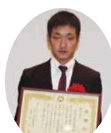
荻田工業高等学校