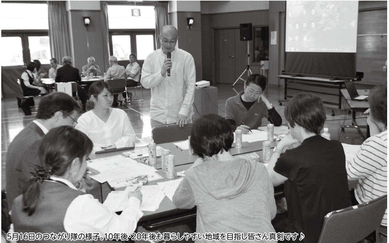
5月16日のつながり隊の様子。10年後・20年後も暮らしやすい地域を目指し皆さん真剣です♪