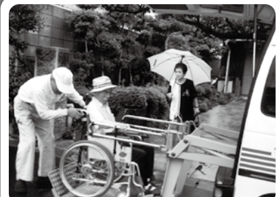
【平成9年5月】 送迎ボランティア派遣事業開始