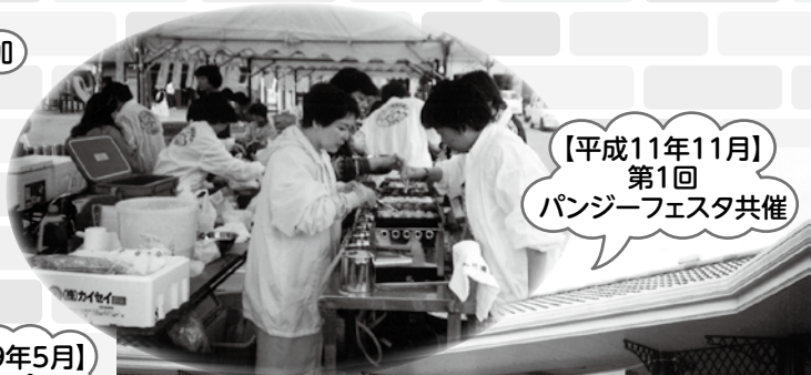
【平成11年11月】 第1回 パンジーフェスタ共催