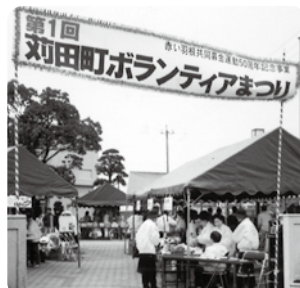
【平成9年3月】 苧田町ボランティアまつり