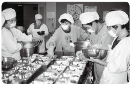
【平成7年1月】 配食サービス事業を苧田町より受託