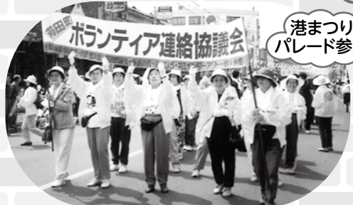
港まつり パレード参加