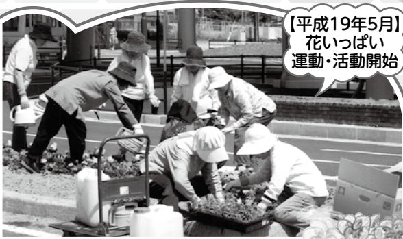
【平成19年5月】 花いっぱい 運動・活動開始