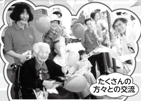
たくさんの 方々との交流