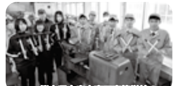
熊本県立鹿本商工高等学校の災害支援ボランティア班の皆さん

第7クール(9/30~10/4)で災害ボランティアセンターの運営支援に行かせていただきました。