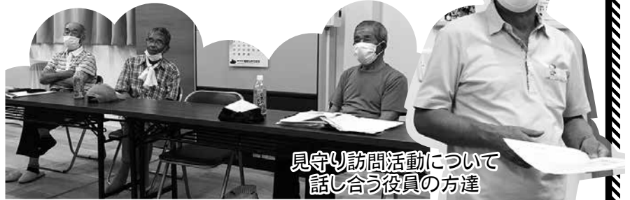
見守り訪問活動について話し合う役員の方達

新津区小地域独自の気くばり対象者名簿を作られており、地域の中で気になる方達の情報を共有しています。