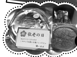
くすの木作業所の「菓子工房 LAPAN」のお菓子の詰合せ