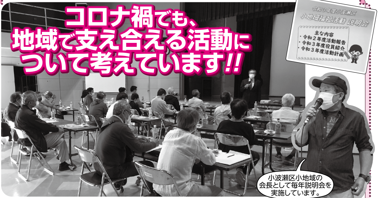
小波瀬区小地域の 会長として毎年説明会を 実施しています。

4月25日(日)に、小波瀬コミュニティセンターにて、小波瀬区小地域福祉活動主催の「小地域福祉活動についての説明会」が行われました。推進委員さんと福祉委員さんが全員参加され、サロン、見守り活動、敬老事業等を含めた小地域福祉活動の目的に対する理解を深めることができました。