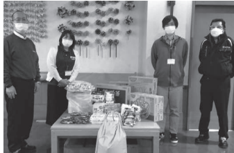
▲トヨタ自動車九州(株) 荻田工場様 食料品