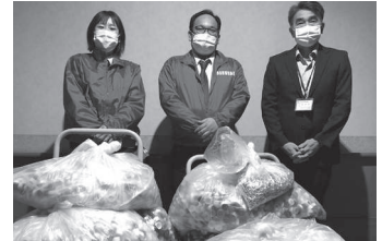
▲マルハン荻田店様 プルタブ 2kg ペットボトルキャップ 約64kg