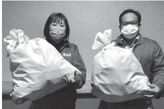
▲マルハン荻田店様 お菓子等