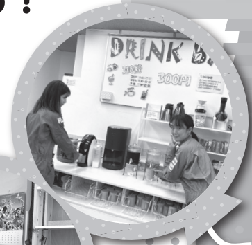
◀3時間300円で ドリンクバーを 利用しながら、 勉強をしたり 漫画を読んだり…