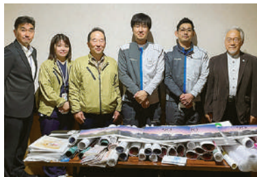
日産自動車(株) 工長会様