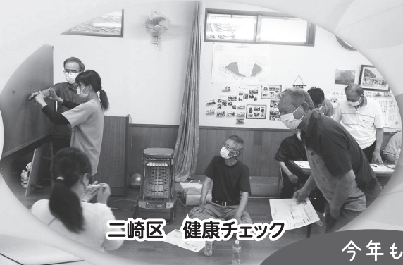
二崎区 健康チェック