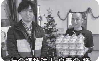
社会福祉法人 白寿会様

今回、地域貢献活動の一環として、荻田町社会福祉協議会で開催しましたフードパントリーで配布する食料等を各法人がフードドライブにて集めました。