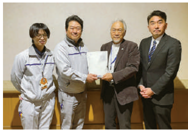
TOTO プラテクノ union 苅田支部様