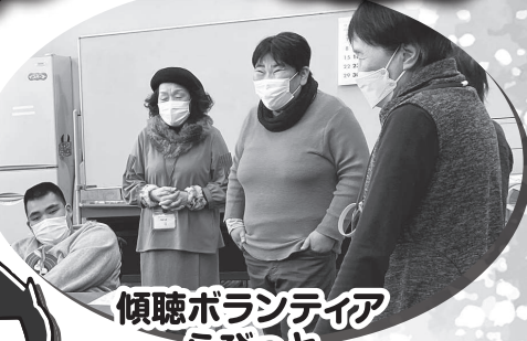
傾聴ボランティア らびっと