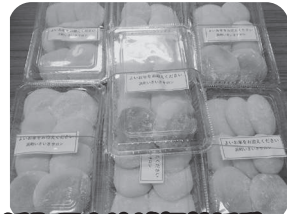
浜町区小地域福祉活動から つくたてのお餅