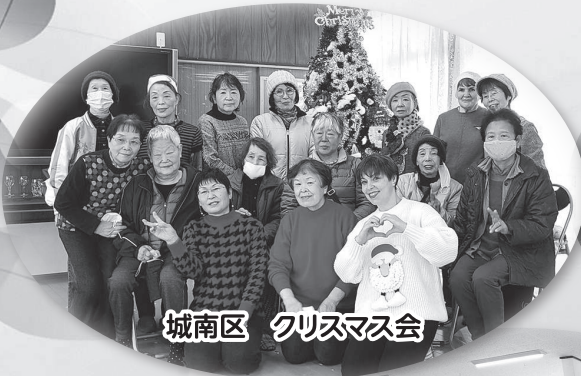
城南区 クリスマス会