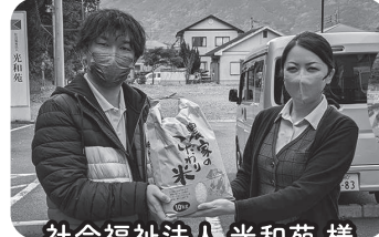
社会福祉法人 光和苑様