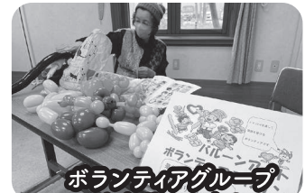
ボランティアグループ ふわりんによる バルーンアートのお土産