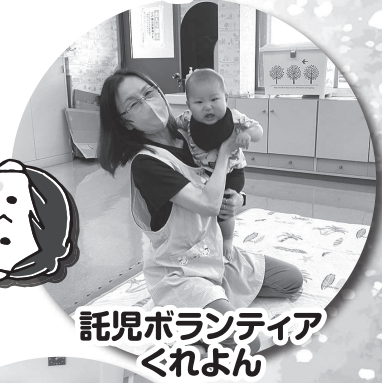
託児ボランティア くれよん