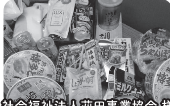
社会福祉法人 荻田事業協会様