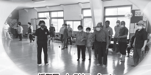
浜町区 レクリエーション