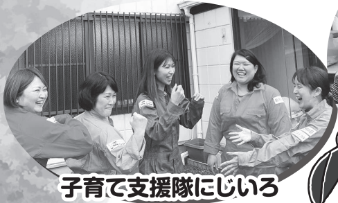
子育て支援隊にじいろ