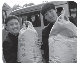
フードパントリーにご協力くださった皆様