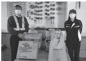
トヨタ自動車(株)苅田工場 様