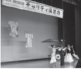
チャリティー演芸会参加者一同 様 金200,587円

● 匿名の方より オムツ他の寄付をいただきました ● 匿名の方より した ● 匿名の方より お米の寄付をいただきました