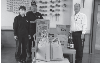
トヨタ自動車九州(株) 菟田工場 様 食料品