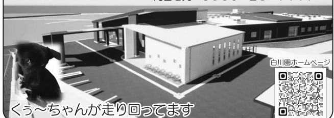
くう~ちゃんが走り回ってます