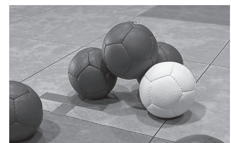
レベルの高い決勝戦、 ボールが乗りました!

白石区・緑ヶ丘区・百合ヶ丘区・新津区・今古賀区・小波瀬区の皆さん、お疲れさまでした!