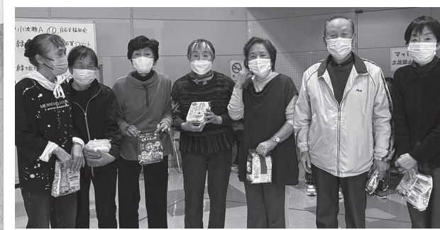
優勝したチームあらつ(新津区)の皆さん