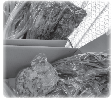
野菜を寄贈いただきました!