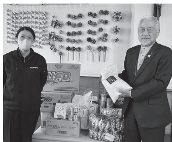
トヨタ自動車九州(株) 苺田工場 様より 食料品 (インスタント食品・お菓子)